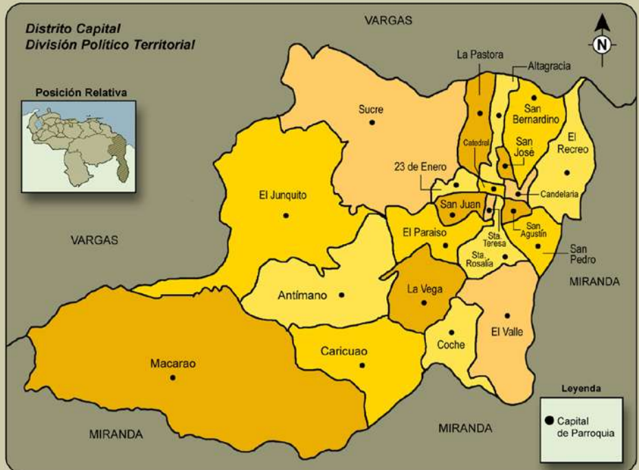
Población y Viviendas, según Parroquia, Censo 2001

Nota: La población total del Censo comprenderá el dato presentado en este informe más la estimación de la población omitida que se obtenga de la Encuesta Evaluativa del Censo realizada con este fin.