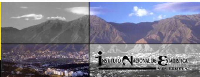
Población, Densidad y Crecimiento, Censos 1873 - 2001

Noviembre de 2002, Editado por el Instituto Nacional de Estadística, INE